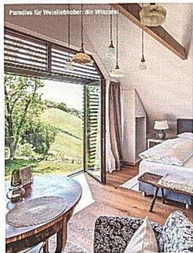
Paradies für Weinliebhaber: die Winzaree